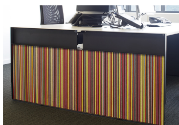
Personnalisez votre 2.connect avec des inserts en mélaminé ou acoustiques.